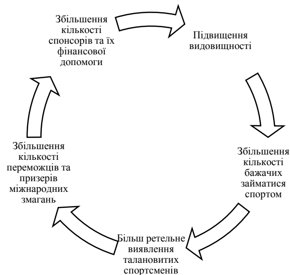
Рисунок 1 – Ланцюжок вирішення сьогоденних проблем у спорті

видовищності спорту сприятиме збільшенню кількості охочих займатися цим спортом; 2) через збільшення кількості бажаючих людей присвятити свій вільний час спорту й бажання батьків віддати своїх дітей у спортивні секції збільшиться необхідність у професійних тренерах та спортивних школах; 3) велика кількість дітей у спорті означає більший вибір для олімпійських комітетів талановитих дітей для продовження участі в міжнародних змаганнях; 4) добре підготовлені діти і спортивні бази сприятимуть збільшенню кількості нагород на міжнародних турнірах та олімпіадах, що неодмінно привабить глядачів і вболівальників; 5) велика кількість глядачів, у свою чергу, привабить спонсорів, які вклатимуть великі гроші в спорт. Цей логічний ланцюжок можна зобразити у вигляді замкненого кола, оскільки великі грошові вкладення, що раніше надходили від держави, будуть тепер вноситися спонсорами, а це неодмінно приведе до розвитку спорту та збільшення його видовищності (рис. 1).