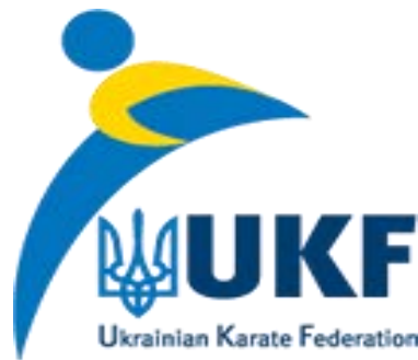
Рисунок 10 – Фірмовий блок Української Федерації Карате

За приклад можна запропонувати рекламну кампанію чемпіонату України з карате, де організатором чемпіонату є Українська Федерація Карате. Саме вона є рекламодавцем. Для того щоб люди краще впізнавали її на афішах, буклетах та на іншій рекламі, повинен бути відповідний фірмовий блок (рис. 10).