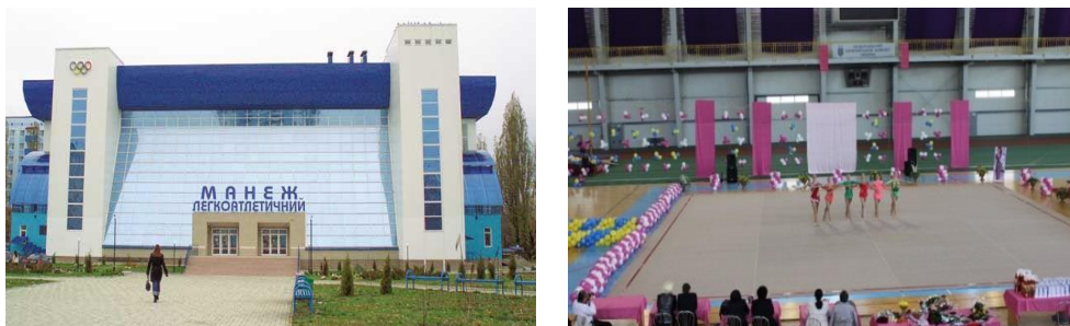
Рисунок 2 – Легкоатлетичний манеж Української академії банківської справи (м. Суми)

Як висновок, можна зазначити, що для значних міжнародних змагань Київ і Львів підходять найкраще – міста забезпечені аеропортами, готелями високої категорії, є палаци спорту. Проте проводити змагання на рівні країни та регіонів, а також інші змагання місцевого значення, де учасниками є спортсмени з однієї або декількох областей, не вигідно. Найкраще для такої мети підходить місто середнього розміру, наприклад, м. Суми. Це пов'язано з нижчою ціною оренди спортивного комплексу для проведення змагань, нижчою ціною на проживання й харчування, ближчим розташуванням місця проживання спортсменів до місця проведення змагань. Досить істотно різниця щодо вартості проведення змагань зменшує бюджет змагань як для федерації, так і для учасників. Наприклад, останніми роками чемпіонат України з художньої гімнастики проводиться в м. Суми через зручний легкоатлетичний манеж (загальна площа – 11300 м 2 , загальна кількість місць близько 3000, 8 бігових доріжок, 6 легкоатлетичних секторів, основне поле чи 8 майданчиків та кортів) і житло для спортсменок поряд із ним (рис. 2).