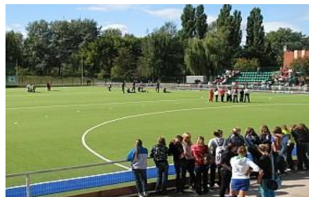
Рисунок 5 – Стадіон для хокею на траві в дитячому парку «Казка» (м. Суми)