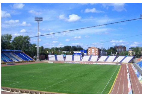
Рисунок 6 – Типовий стадіон районного центру