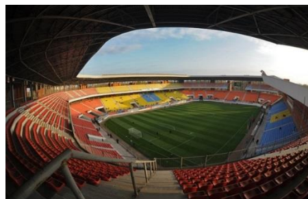
Рисунок 3 – Сумський міський стадіон «Ювілейний» на 25830 глядацьких місць