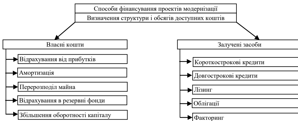
Рисунок 1 – Способи фінансування модернізації промислового підприємства

обумовлюється довгостроковим функціонуванням основних фондів, відсутністю системності при появі нових технічних і технологічних рішень, а також значною невизначеністю виробничої та інвестиційної активності. Виходячи з фінансового стану підприємства, а також інвестиційної активності на фінансових ринках, підприємство повинно сформувати політику підтримки оптимального співвідношення між власними та залученими коштами. План інвестицій у загальному вигляді передбачає наявність сукупності планів портфельних інвестицій, реальних інвестицій і капітальних вкладень. В основу цього плану повинна бути закладена структура й обсяги прогнозованих фінансових коштів, що схематично наведені на рис. 1.