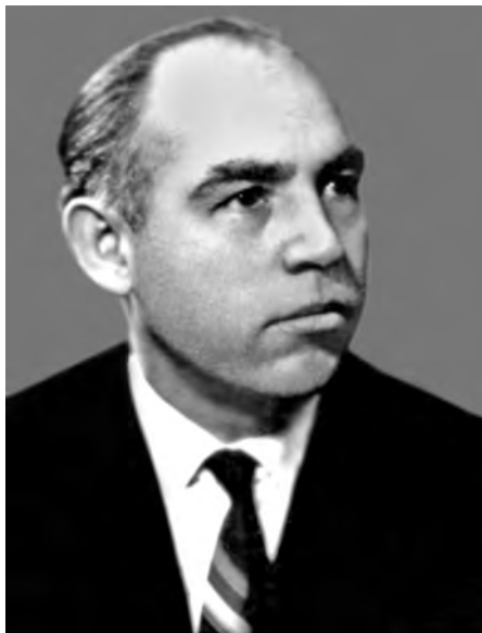
Рис. 1. Ректор Львівського державного університету імені Івана Франка