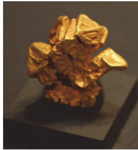
Фото 6. Золото, маса взірця – 154,5 г. Каліфорнія, США.

Оскільки золото практично не піддається корозії і має високу ціну, воно зберігається вічно. До цього часу у вигляді злитків, монет, ювелірних виробів і предметів мистецтва збереглося майже 90 % золота, добутого за історичний період. Унаслідок щорічного світового видобутку цього металу його сумарна кількість збільшується майже на 2 %. Колекція золота в музеї налічує дуже багато взірців і постійно поповнюється.