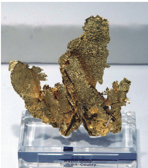
Фото 1. Золото. Родовище Кріпл-Крік, Вейпін, округ Самміт, Колорадо, США.

Мінерали та їхні асоціації – це головний ресурс для розвитку цивілізації, тому значна частина експозиції представлена експонатами мінерального царства. Великими є колекції самородного золота та срібла. Представлені в колекції самородки цих металів вражають не тільки розміром, а й строкатістю морфологічних форм.