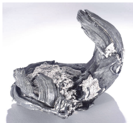
Фото 10. Срібло. Родовище Конгсберг, Норвегія.

Отже, Національний музей природничої історії завдяки дослідженням, колекціям і виставковим програмам є одним з найбільших сховищ наукової і культурної спадщини у світі, джерелом величезної гордості не тільки для американців, а й матеріальним і духовним надбанням усього людства. Геологічна колекція музею дає змогу зазирнути його відвідувачам на декілька сотень мільйонів і навіть мільярдів років назад, на власні очі побачити ту матерію, що виникла з протопланетної хмари і стала основою для формування нашої планети; простежити еволюцію розвитку речовини земної кори від елементів через мінерали до гірських порід та побачити розмаїття її форм; помилуватися природною та набутою (унаслідок ювелірної обробки) красою й досконалістю окремих кристалів тощо.