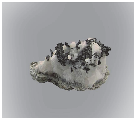
Фото 9. Срібло у кальциті. Новий Південний Уельс, Австралія.