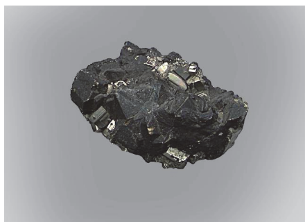
Фото 7. Срібло. Лусака, Замбія.