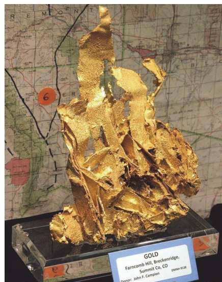
Фото 4. Золото. Родовище Кріпл-Крік, Фарн-комб Хілл, Брекенридж, округ Самміт, Колорадо, США.