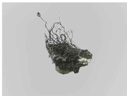
Фото 8. Срібло. Новий Південний Уельс, Австралія