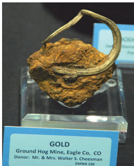
Фото 3. Золото. Родовище Кріпл-Крік, Граунд-Хог Майн, округ Ігл, Колорадо, США.