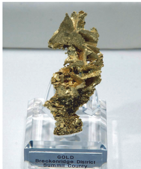
Фото 2. Золото. Родовище Кріпл-Крік, Брекенридж Дистрикт, округ Самміт, Колорадо, США