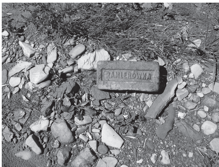
Рис. 1. Розтріскана цегла сучасного виробництва порівняно з “Ramblerówka”, яка має ознаки повної збереженості й часткової обкатаності в русловому алювії р. Лючка (с. Стопчатів).

Крім того, залишки руслового алювію засмічені уламками бетону, кераміки й цегли. Зазначимо, що технологія виготовлення будівельних матеріалів 30-х років ХХ ст. відрізняється від сучасної (рис. 1).