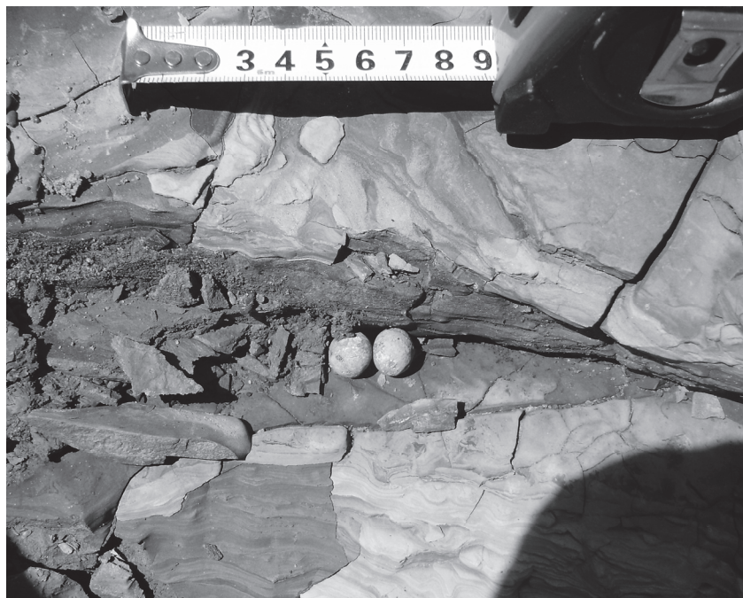
Рис. 2. Кулі мисливської зброї в ніші корінних порід стебницької світи, правий берег р. Прут, смт. Ділятин.

Навіть після повного змивання алювіальних відкладів катастрофічною повінню 2008 р. на оголеному плоту корінних порід стебницької світи в невеликих нішах відшуковують мисливські кулі, що не влучили в ціль під час полювання, наприклад, по р. Прут Ділятинського Заріччя (рис. 2).