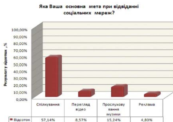
Рис. 4 Результати опитування по четвертому питанню

розділились більш-менш рівномірно. Тут не проявляється яскраво вираженого домінування. Відштовхуючись від даного результату можна сказати, що опитані респонденти не так вже й часто заходять в соціальній мережі на протязі дня, що, зважаючи на результати інших опитувань [9], являється значно нижчим і дозволяє формувати думку про те, що нинішня студентська молодь не живе тільки віртуальним, а реальним життям.