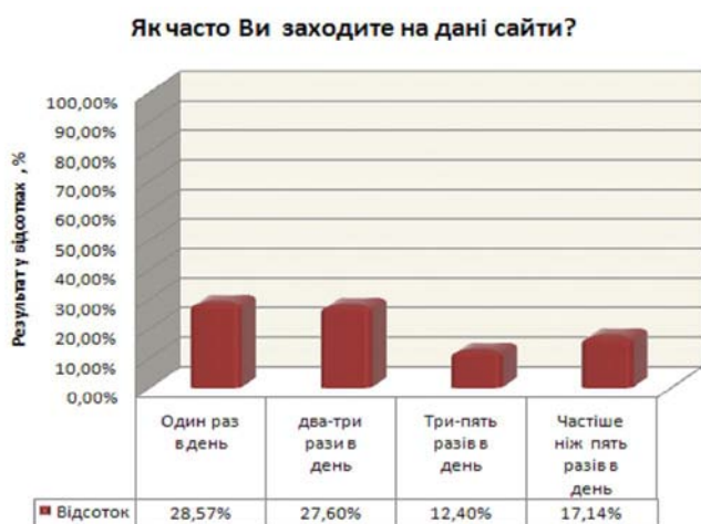
Рис. 3. Результати опитування по третьому питанню