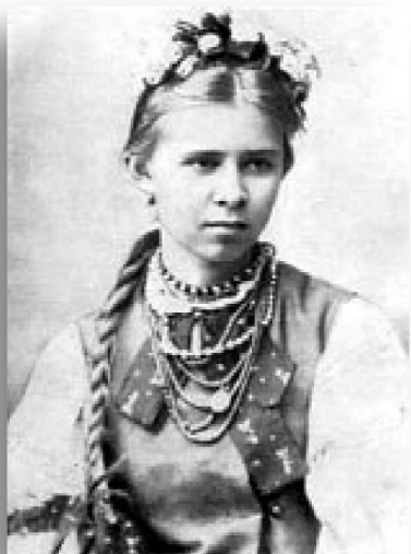
Лесі Українки (Л. П. Косач) (1871 – 1913) української письменниці громадського діяча

25 лютого 2011 року 140 років від дня народження