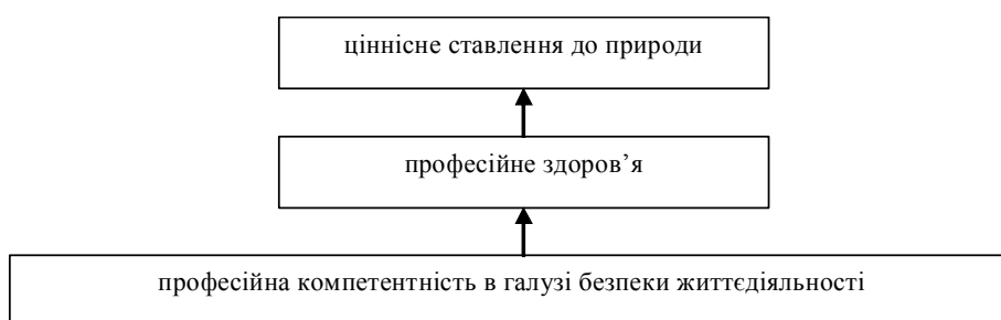
Схема 1. Ієрархія професійних цінностей майбутніх аграріїв

Виклад основного матеріалу. Аксіологічними основами безпеки життєдіяльності при підготовці майбутніх аграріїв є зміст навчального матеріалу, на базі якого у студентів формується система ієрархічно залежних професійних цінностей (схема 1.).