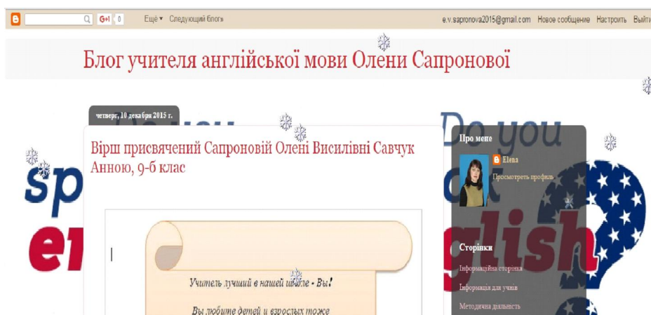
Рис. 2. Фрагмент блогу вчителя англійської мови Смирної Олени Василівни ЗОШ І – ІІІ ст. №9 м. Бердянська