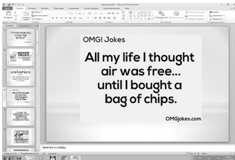
Рис. 1. Ситуація для обговорення

використовувати розбірливий шрифт (розмір букв, цифр, знаків, їх контрастність мають бути такими, щоб студентам з останніх парт було добре видно презентацію); розмішувати на слайді лише основну інформацію (пропозиції, визначення, слова, терміни, які студенти будуть записувати в зошити, читати угорос тощо, під час демонстрації презентації); заливка фону, букв, ліній має бути спокійного, “неотруйного” кольору, що не буде подразнювати й втомлювати очі студентів, креслення, рисунки, фотографії та інші ілюстраційні матеріали повинні максимально рівномірно заповнювати все екранне поле, бути високої якості, чіткості, контрастності, не слід перевантажувати слайди зоровою інформацією; на перегляд одного слайда слід відводити достатньо часу (не менше 2 – 3 хвилин), щоб студенти могли сконцентрувати увагу на зображенні, простежити послідовність дій, розглянути всі елементи слайда, зафіксувати кінцевий результат, зробити записи в робочі зошити; звуковий супровід слайдів не повинен бути різким, відволікати чи