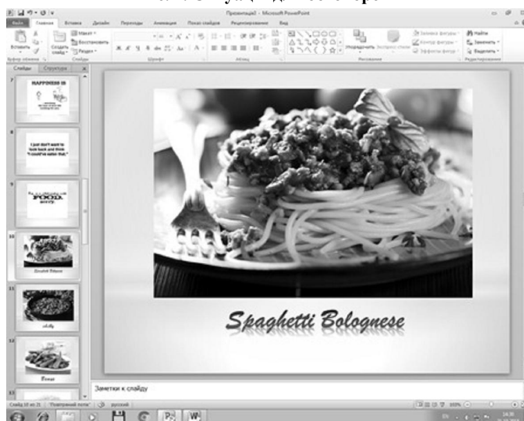
Рис. 2. Зображення всесвітньовідомої страви