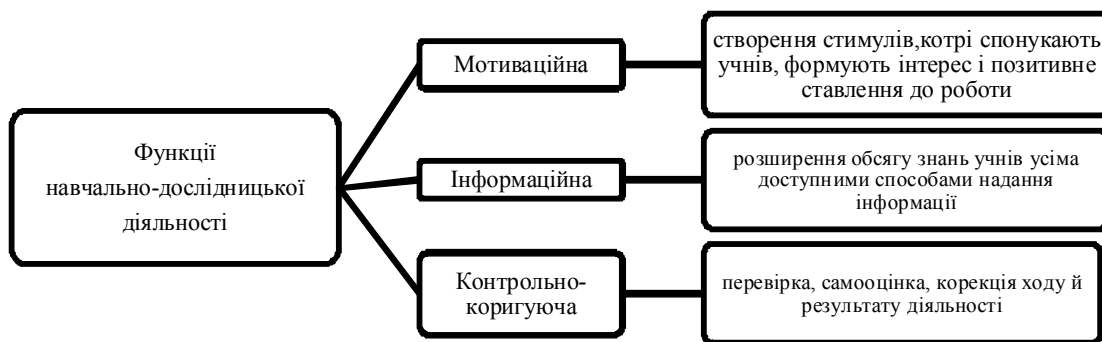
Рис. 1. Функції навчально-дослідницької діяльності