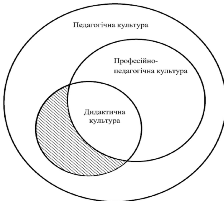
Рис.1. Співвідношення понять “педагогічна культура”, “професійно- педагогічна культура”, “дидактична культура”

(Рис.1). Носієм, суб'єктом дидактичної культури в нашому дослідженні виступає викладач вищого навчального закладу, який здійснює процес навчання в інноваційному режимі, що відповідає цілям і завданням сучасного навчального закладу.