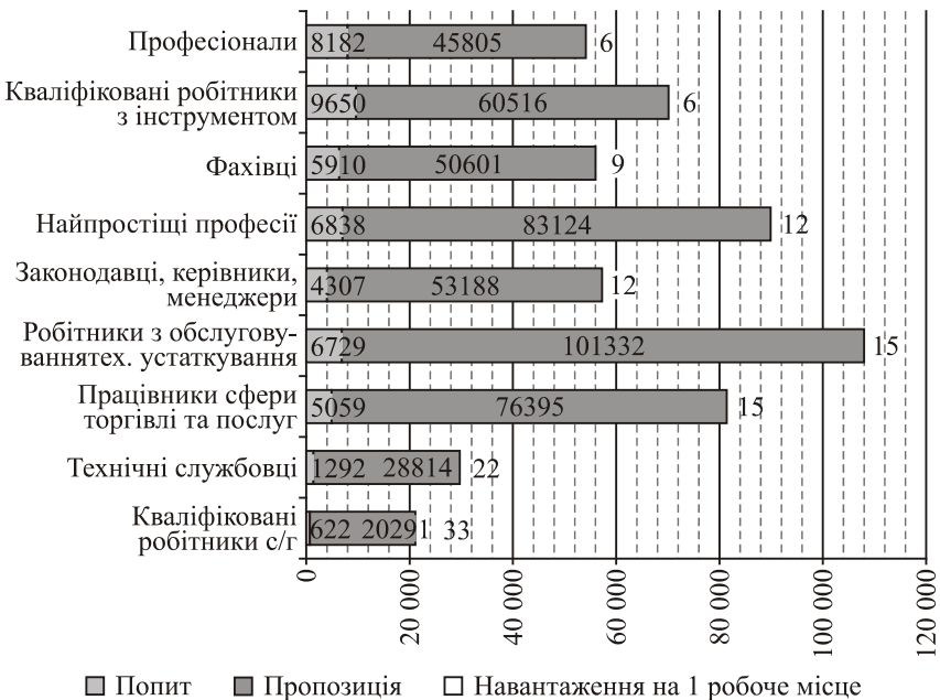
Рис. 2. Співвідношення попиту та пропозиції робочої сили за професійним складом в Україні у 2012 р.

За професійним складом найбільш збалансованою групою у 2012 році є професіонали. Навантаження на одне робоче місце в цій групі складає лише 6 осіб і по відношенню до інших груп така ситуація виглядає досить прийнятною. Для порівняння: у технічних службовців — 22 особи на одну вакансію, а у кваліфікованих робітників сільського господарства — 33 особи на одне вільне робоче місце (рис. 2).