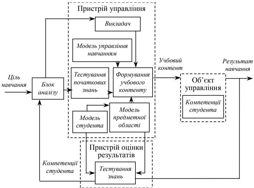
Рис. 2. Функціональна схема процесу управління навчанням

До складу ПУ входить викладач, який здійснює коригування управлінських дій, спрямованих на ОУ у тому випадку, коли автоматизована система управління навчанням не здатна самостійно ефективно управляти індивідуальною освітньою траєкторією студента.