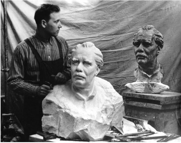
Робота над погруддям поета Павла Безпощадного

ріод батько згадує: «Воєнний госпіталь міста Єсентуки мав нестаток продовольства для поранених, і наш колгосп надавав йому дійову підтримку; мені, як члену колгоспу, надавалася медична допомога. Мрія отримати художню освіту мене не залишала. У 1945 р. головний лікар санчастини, знаючи про моє бажання навчатися у Києві, запропонував супроводити одного хворого, інваліда війни, додому, на Житомирщину. Доручення лікаря я виконав, а після цього приїхав до Києва. У приймальній комісії художнього інституту в мене відбулася бесіда з Карпом Дем'яновичем Трохименком, і я зрозумів, що шансів у мене, живописця-самоуки, мало, тож вирішив складати іспити на скульптурний факультет. Незважаючи на те, що ліпленням я давно не займався, одразу пригадався і мій приятель, і той захват від відчуття того, що я, хоч і не Бог, а зліпити щось все ж таки можу, і руки самі почали впевнено працювати. Іспити я склав і був зарахований на перший курс; щоправда, про те, що таке каркас, і як його робити, я дізнався лише на іспиті».