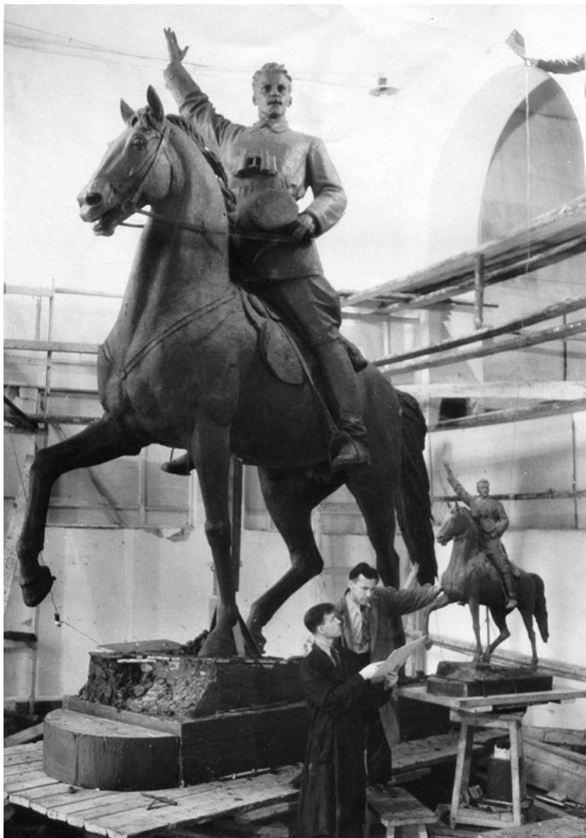
Робота над пам'ятником М. О. Щорсу