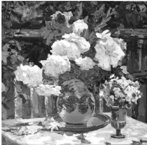
«Квіти», 1970-і, масло, полотно