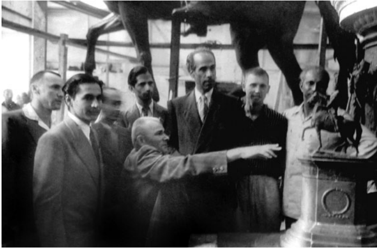
Обговорення ескізної моделі пам'ятника М. О. Щорсу, 1953

портрет в обмін на кавун. В процесі роботи портрет став мені неясно когось нагадувати. Побачивши його, Султан залишився задоволеним і сказав: «Як Сталін! Завжди приходь!». Того літа кавунами я був забезпечений, і це був мій перший заробіток, як художника-портретиста», — пригадує батько.