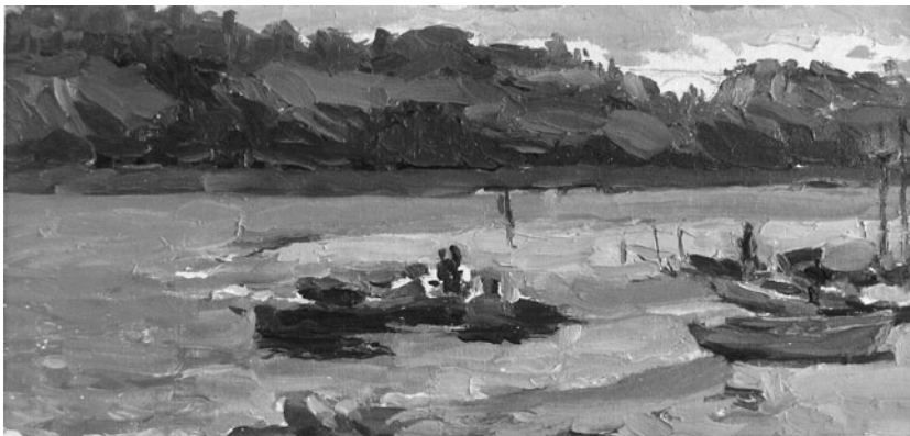
«Берег річки», 1950-і, масло, картон

роботи виникали різноманітні курйозні випадки, і бригадир запропонував мені висвітлювати їх в стінгазеті — писати статті, робити художнє оформлення, малювати карикатури. Таким чином з'явилась перша стінгазета колгоспу ім. Е. Тельмана, і я став незмінним членом її редколегії». У 1935 р. батько почав працювати кореспондентом в районній газеті «Ударник»; в шостому класі взяв участь у районному огляді художньої самодіяльності з персональною виставкою живопису, де отримав першу премію у розмірі 250 крб. «В той час кінофільми, які показували в нашому сільському клубі, ще не мали журналів. Я вирішив спочатку демонструвати злободенний матеріал — на чистій плівці чотириох-п'яти метрів писав текст і малював карикатури. Такий «кіножурнал» на екрані справляв вражаючий ефект: до нього боялися потрапити всі. Якимось дорогою я зустрів їжака і одразу пригадав, що нашому єдиному в клубі грамофону конче потрібні нові голки, бо старі вже дуже сточені. Обережно взяв його, приніс додому, зістриг декілька голок і, відпустивши перелякану тваринку, поклав їх трошки підсушити. Згодом побіг до клубу експериментувати. За кілька днів перед очима здивованої молоді виникла об'ява: «Прослуховування класичної музики на патефоні з голками їжака».