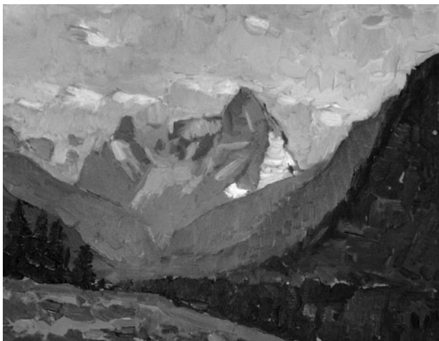
«Кавказ», 1970-і, масло, полотно

М.В. Лисенко (1955–1962), О.С. Пушкіну (1954–1956) — усі три для Києва; В.І. Леніну для Москви (1958–1960) і Запоріжжя (1964). В своїх творах батько багато уваги приділяв створенню психологічного портрету моделі, робив безліч ескізів, намагаючись знайти найправдивіші риси. Такий пам'ятник О.С. Пушкіну (1960) для м. Еліста, надгробки академіку Протопопову (1960), письменнику В.С. Кучеру (1968), Г.Ф. Бойко (1979), скульптура Скорботної матері на братській могилі в с. Синьківка на Київщині (1989), історичні портрети — М.В. Гоголя (1958), М.О. Щорса (1963); портрети сучасників: батька (1962), матері (1962), вчителя (1986) тощо. Остання його робота — надгробний пам'ятник відомому музиканту і викладачу Київської консерваторії О.М. Горохову. Майже п'ятнадцять років батько очолював республіканську художню раду оцінки творів, і, згідно свідченням скульпторів, був принциповим та справедливим суддею, котрий понад усе цінував композиційну гармонію. Постаць В.І. Леніна в батьківському житті та творчості мала неабияке значення. Змалку він захоплювався цією особистістю і зберіг своє дитяче ставлення донині. Отримуючи доручення працювати над цим образом, батько спершу ретельно вивчав фотоматеріали та роботи інших митців; читав відповідні книги, фіксував різні емоційні стани. Батькові твори зберігаються в Національному художньому музеї України, Донецькому і Луганському худож-