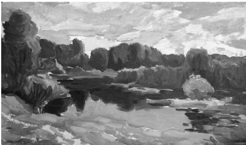
«Седнів», 1960-і, масло, картон

тами живописного факультету їздив на літню практику в Карпати. Якось один з живописців в день перегляду виставив і роботи батька. Т.Н. Яблонська під час перегляду запитала, чиї вони, і, дізнавшись, що їх автор — скульптор, здивувалася і звернула увагу присутніх на те, як написано небо. Батько був дуже задоволений і з того часу вже свідомо особливу увагу приділяв стану неба. Ще одна історія відбулася з ним пізніше, вже після вступу до НСХУ (1955); згадуючи її, він щоразу відчувається щасливим: «Наші майстерні з К.Д. Трохименком були поруч, і якимось я зустрів його та запросив пройти до його майстерні більш коротким шляхом, крізь мою. Коли він зайшов, я запропонував йому подивитися мій Кавказький етюд. Карпо Дем'янович погодився. Він дивився на нього досить довго, мені навіть здалося, що він задрімав, але я вирішив його не турбувати. Через деякий час він підвівся і сказав мені: «Дякую вам за гарний етюд, дуже вдалий вибір мотиву, чудове виконання».