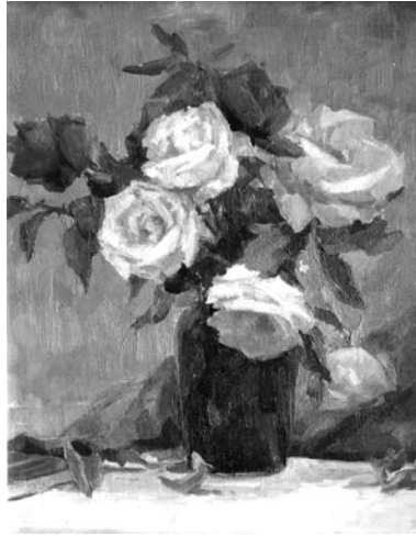
«Троянди», 1980-і, масло, полотно

ніх музеях, Національному історико-етнографічному заповіднику «Переяслав», Великосорочинському літературно-меморіальному музеї М. В. Гоголя, Донецькому краєзнавчому музеї, Державному історичному музеї в Москві, музеї В. І. Леніна в Горках. У 1968 р. йому присудили звання заслуженого діяча мистецтв.