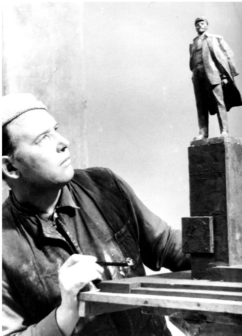
Робота над проектом пам'ятника В. І. Леніну