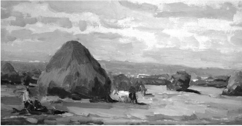
«Літні роботи», 1950-і, масло, картон