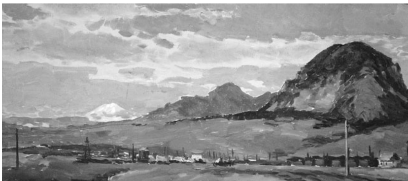
«Змійка та Бештау», Кавказ, 1970-і, масло, картон