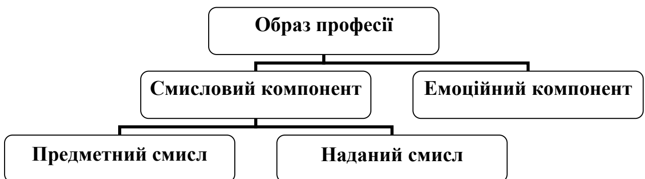
Рис. 1. Структура образу професії

Методологічною та теоретичною основою нашого дослідження образу професії стали концепції психічного образу О.М. Леонтьєва [5], С.Д. Смирнова [10], А.В. Петровського, М.Г. Ярошевського [8], А.А. Гостева [4], Ф.Є. Василюка [3]; психологія смислу Д.О. Леонтьєва [6]; психологія суб'єктивної семантики Є.Ю. Артемьєвої [1]. Ми розуміємо під образом професії цілісну смислову структуру та, спираючись на підхід О.М. Леонтьєва щодо структури свідомості [6], виділяємо в ньому наступні компоненти (рис. 1):