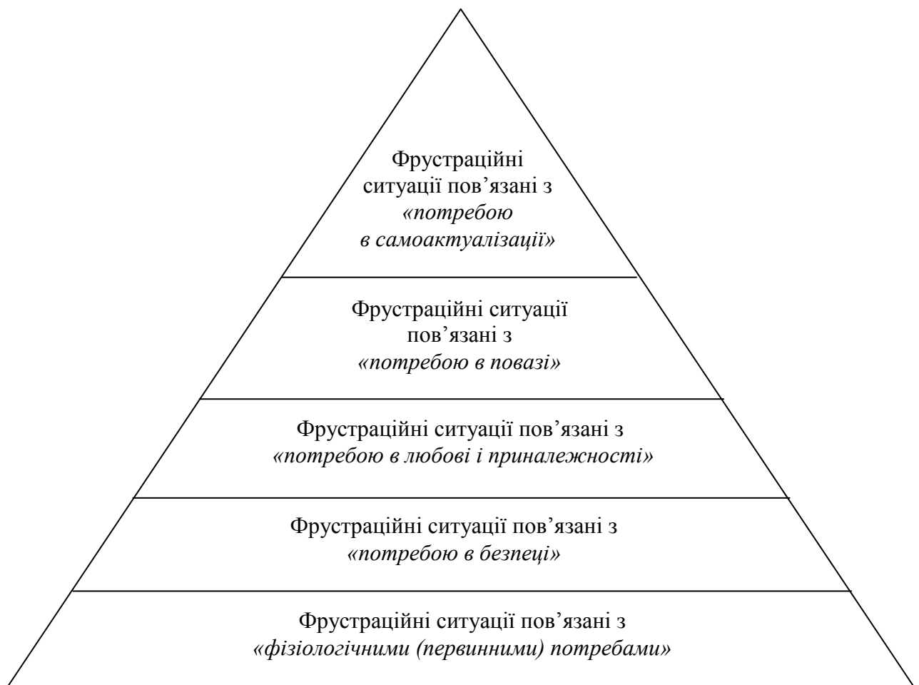
Рис. 1.1 Класифікацій фрустраційних ситуацій на основі піраміди потреб А. Маслоу .

Однією із класифікацій фрустраційних ситуацій може бути піраміда, яка базується на теорії «ієрархії потреб» за А.Маслоу (рис. 1).