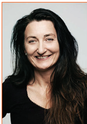
May-Britt Moser. Родилась: 1963, Fosnavåg, Norway. Место работы на момент присуждения премии: Norwegian University of Science and Technology (NTNU), Trondheim, Norway