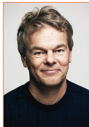
Edvard I. Moser. Родился: 1962, Ålesund, Norway. Место работы на момент присуждения премии: Norwegian University of Science and Technology (NTNU), Trondheim, Norway

Награда присуждена за исследования «внутреннего GPS» головного мозга, отвечающего за ориентацию в пространстве и построение маршрута. Согласно заявлению Нобелевского фонда, исследование ученых помогло понять, как мозг создает «карту пространства» вокруг человека и помогает ему ориентироваться.