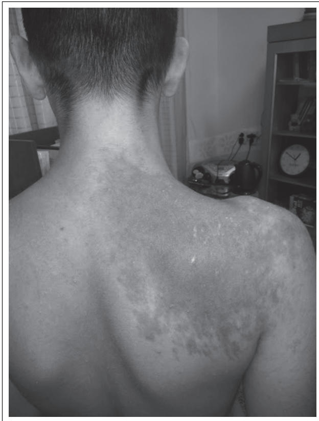
Рисунок 2. Пігментний невус Беккера у дитини з метахроматичною лейкодистрофією

Електроенцефалографія. Висновок: епілептиформна активність не виявлена. Виразені зміни біоритмики у вигляді гіперсинхронізації з періодичним уповільненням кіркової ритмики.