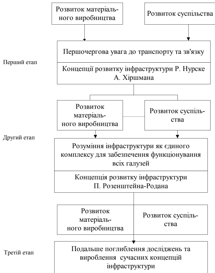
Рис. 3 Еволюція поглядів на сутність поняття «інфраструктура»

Висновки. Ідея, покладена в основу цього визначення, дозволяє сформулювати базові положення концепції інфраструктури в постіндустріальній економіці: