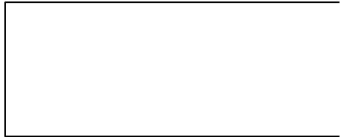
Рис. 2 Схема моніторингу соціально-економічних показників розвитку територій України та визначення депресивних

передбачається, що сума коштів, передбачених для фінансування програм подолання депресивності, не може бути меншою за 0,2% доходної частини Державного бюджету за відповідний період.