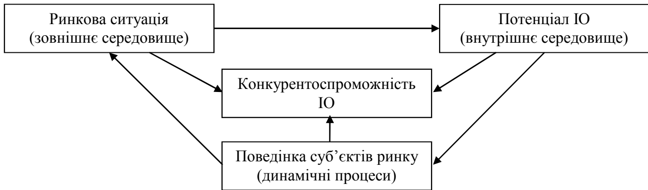
Рис. 1. Взаємозалежність факторів конкурентоспроможності ІО

підприємства); поведінка підприємства (динамічні процеси). Важливо, що дані фактори є взаємопов'язаними і у сукупності своїх змін визначають зміни конкурентоспроможності конкретних суб'єктів сфери ринкової пропозиції, тобто здатності досягнення успіху в конкуренції. Взаємовплив факторів конкурентоспроможності ІО наведено на рис. 1.