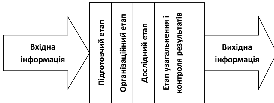
Рис. 3 Кібернетична модель економічної експертизи як інформаційного процесу