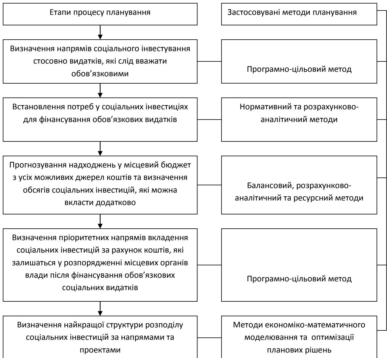
Рис. 2. Послідовність процесу планування обсягів та структури соціальних інвестицій, які здійснюються за рахунок коштів місцевих бюджетів

Загалом, у процесі стратегічного планування видатків місцевих бюджетів, що здійснюються у вигляді соціальних інвестицій у підтримання та розвиток соціальної сфери, постає необхідність послідовного вирішення низки завдань, до яких, насамперед, належать такі: