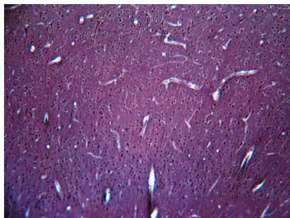
Рис. 1. Участок коры лобной доли мозга крысы после применения карбамазепина в дозе 40 мг/кг. Окраска гематоксилином-эозином. \times 200 .