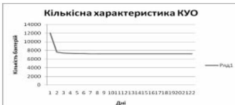
Рис. 2. Графік кількісної характеристики росту КУО в системі MS Excel.