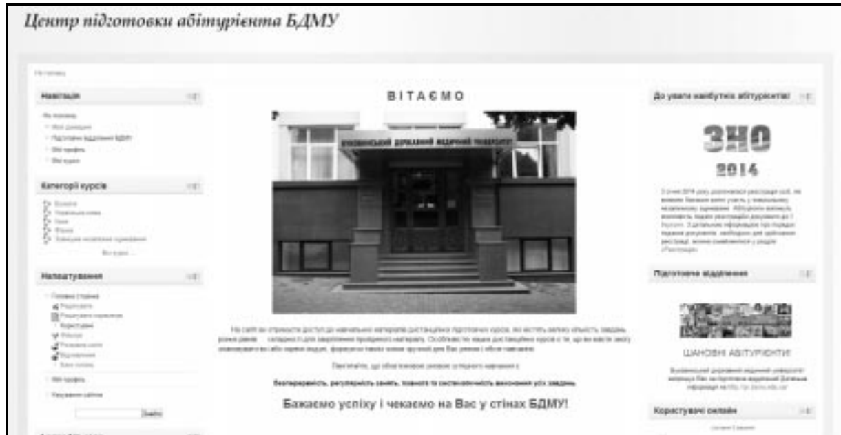
Рис. 2. Центр підготовки абітурієнта БДМУ (zno.bsmu.edu.ua).

Центр підготовки абітурієнта. ІКТ також використовуються при підготовці слухачів до вступу у вищі навчальні заклади України. На платформі “MOODLE” створений Центр підготовки абітурієнта (zno.bsmu.edu.ua) (рис. 2).