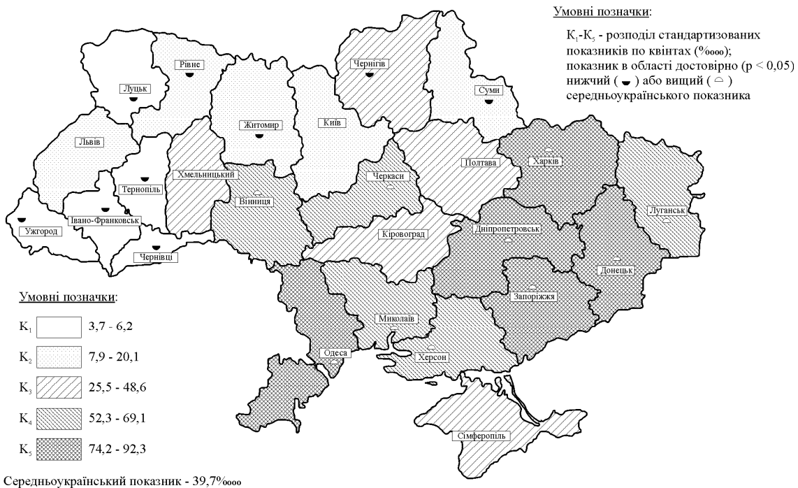
Рис.1. Питома вага населення, що проживає в несприятливих екологічних умовах (рівень забруднення довкілля вищий за гігієнічні нормативи), %

Найменш сприятливі (напружені) соціально-економічні умови проживання зареєстровані у 18,6-25,2% мешканців Північного і Західного регіонів, питома ж вага їх у південних і особливо східних областях України в 1,6-3,6 разу менше (7,0-11,5%).