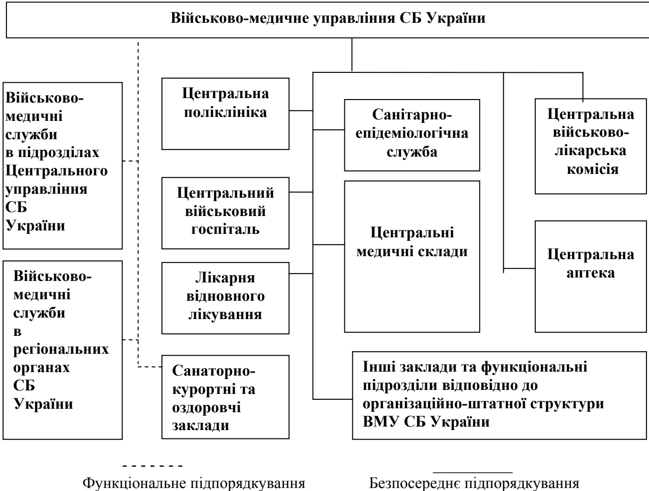
Рис. 2. Організаційно-функціональна структура медичної служби СБ України

закладів охорони здоров'я СБ України призведе, всупереч вимогам ст. 22 Конституції України, до різкого зниження рівня їх соціальної захищеності, загострення у зв'язку з цим соціальної напруги у військових колективах і, як наслідок, до подальшого відтоку кваліфікованих кадрів.