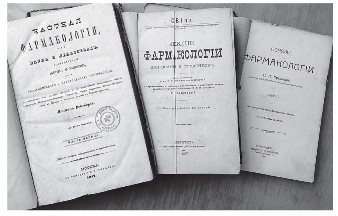
Підручник М.П. Кравкова серед перших підручників з фармакології кінця ХІХ-початку ХХ ст.

матеріально-технічної бази кафедри та було розроблено основи навчально-методичного забезпечення процесу навчання студентів.