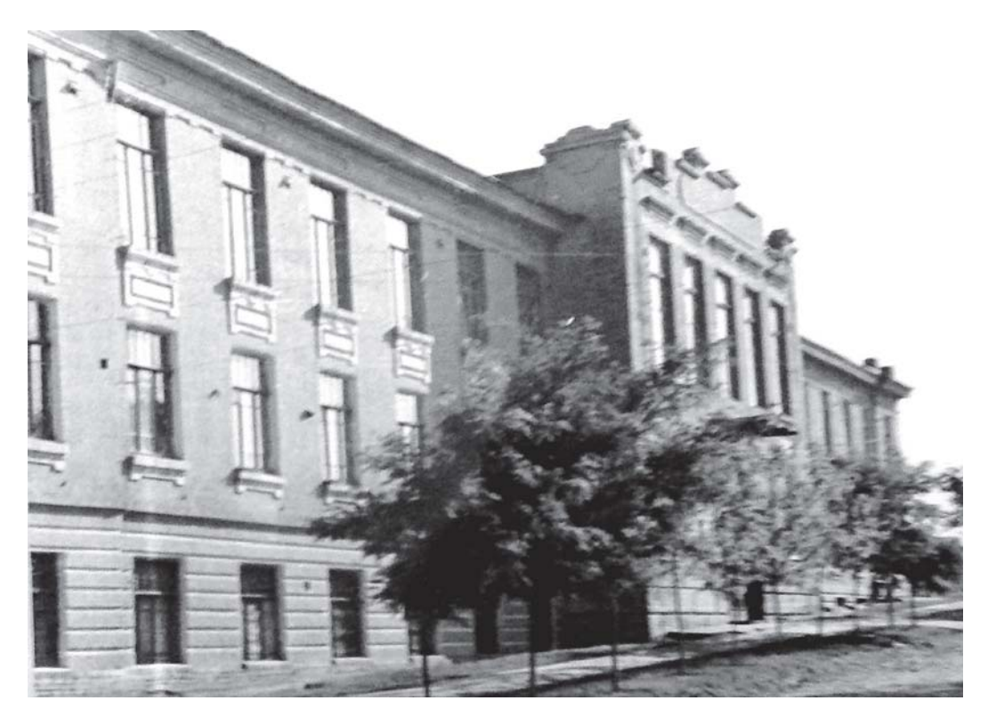
Олексіївський госпіталь, де була розташована кафедра фармакології в 20-х роках XX ст.

В одній з кімнат проводилися теоретичні заняття зі студентами, а в другій була лабораторія, де на практичних заняттях демонстрували дію лікарських засобів на організм експериментальних тварин, зразки препаратів та