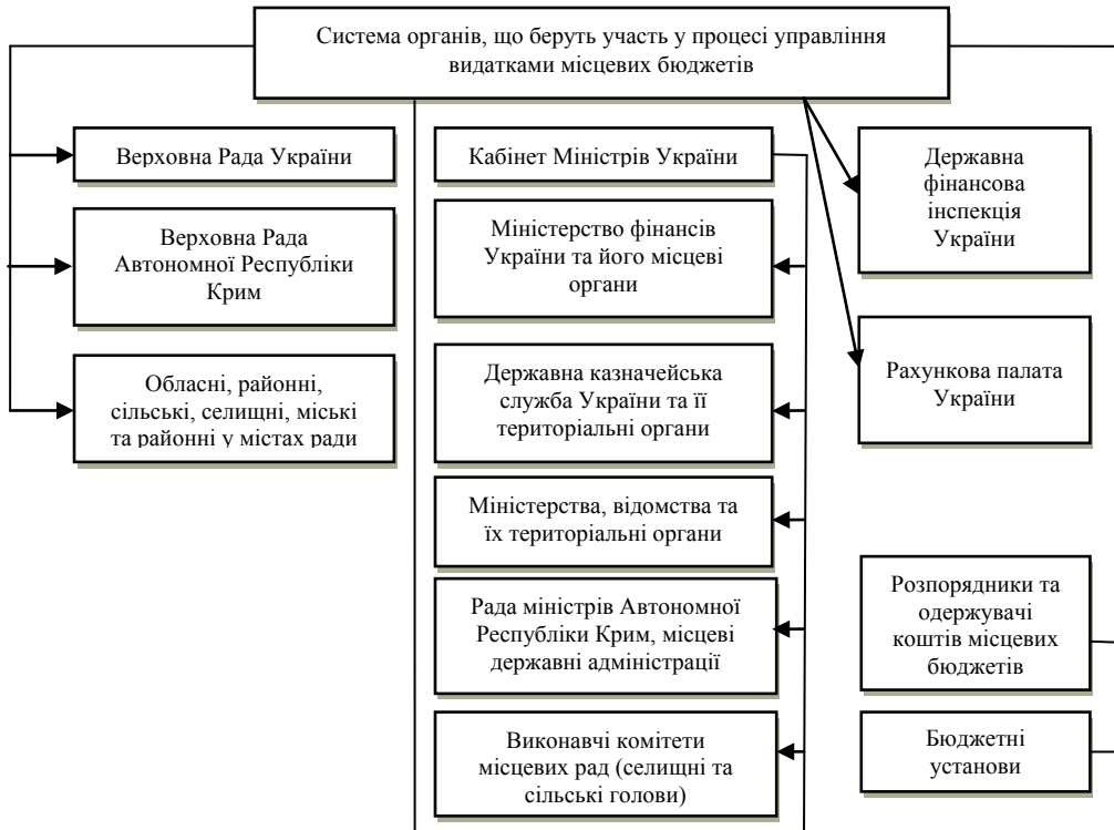
Рис. 1. Суб'єкти управління видатками місцевих бюджетів [3]

– принцип цільового використання бюджетних коштів передбачає їх використання тільки на цілі, визначені бюджетними призначеннями та бюджетними асигнуваннями.