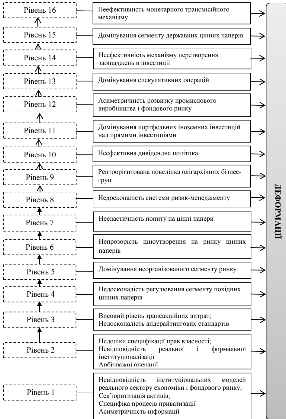
Рис. 2. Модель ієрархії інституційних деформацій фондового ринку України