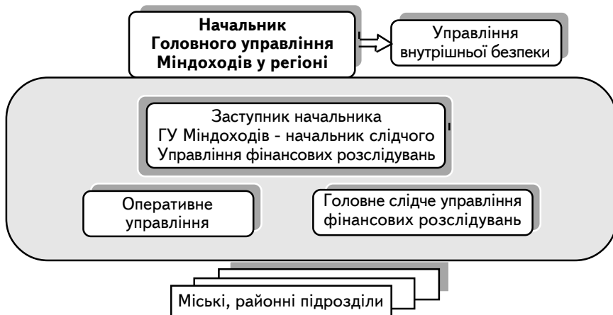
Рис. 3. Сучасна організація податкової міліції на регіональному рівні

підрозділів узагалі не мають права здійснювати процесуальні дії у кримінальному провадженні за власною ініціативою. При цьому доручення слідчого щодо проведення слідчих дій є обов'язковими для виконання оперативними підрозділами.