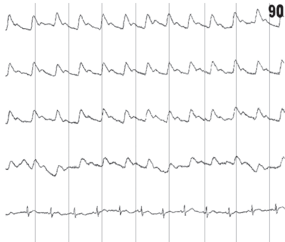
Рис. 2. РЕГ майже в межах норми пацієнтки групи спостереження П., 57 років

На 2-гу добу після введення протеза до ротової порожнини підвищення тону мозкових судин та утруднення венозного відтоку як у каротидній, так і у вертебрально-базиллярній