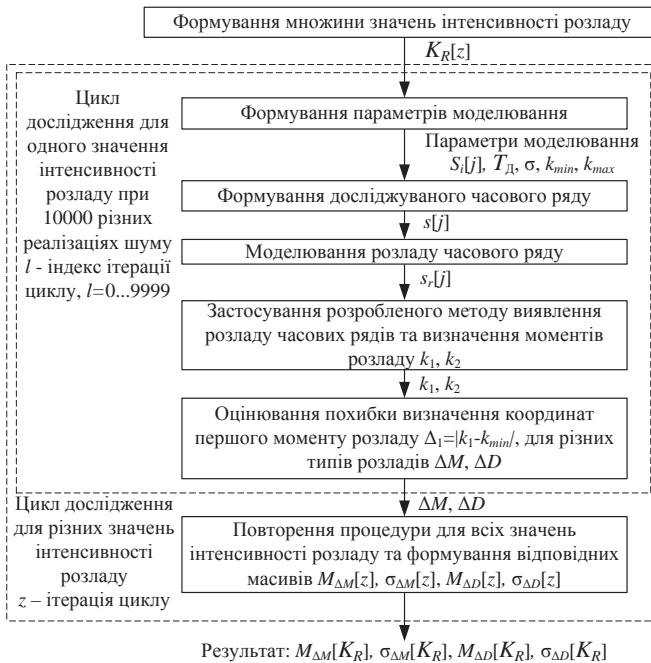
Рис. 2. Структурно-логічна схема проведення комп'ютерного експерименту для оцінювання точності визначення координат миттєвих моментів розладу

Результати. В ході експерименту були отримані наступні результати, представлені в табл. 1.