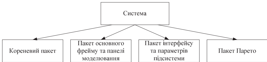
Рис.2. Пакети класів розробленої системи

Для реалізації системи, використана мова Java. Розроблена та реалізована діаграма класів програмного забезпечення зображена на рис.2, а призначення кожного кроку – в таблиці 1.