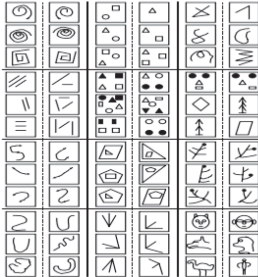
Рис. 1. Приклад об'єктів навчання

В цілому проблема розпізнавання образів складається з двох частин: навчання та розпізнавання. Навчання здійснюється шляхом показу окремих об'єктів із зазначенням їх приналежності до того чи іншого образу. В результаті навчання система, яка розпізнає, повинна набути здатність реагувати однаковими реакціями на всі об'єкти одного образу та іншими реакціями - на всі інші об'єкти. Дуже важливо, що процес навчання повинен завершитися тільки шляхом показів певної кількості об'єктів. Як об'єкти навчання можуть бути або картинки (рис. 1), або інші візуальні зображення (літери, цифри) [5].