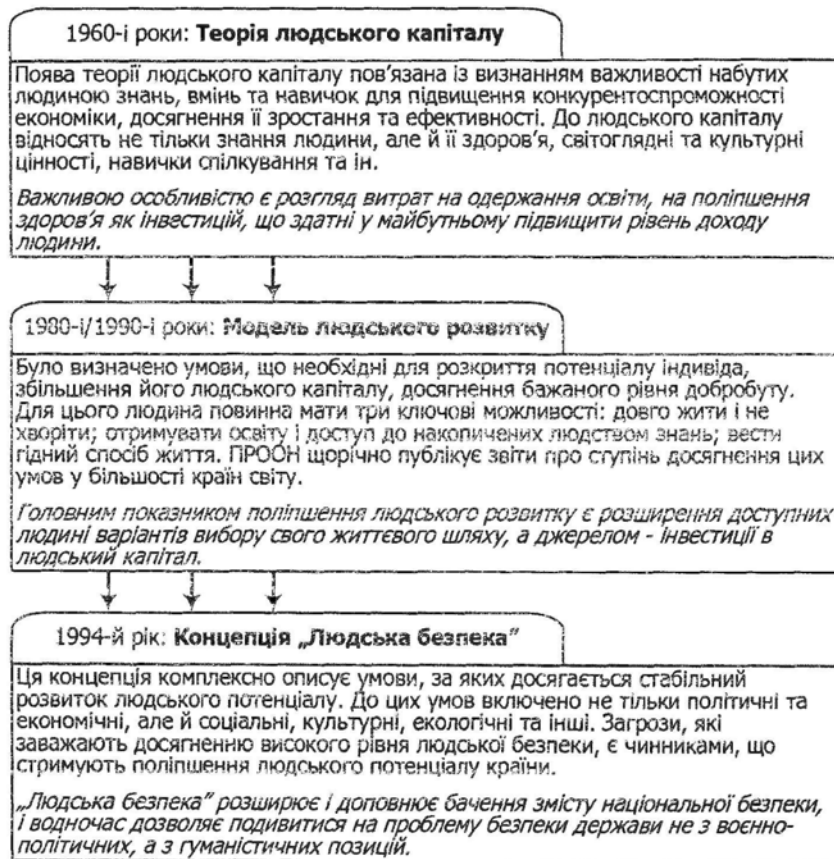
Рисунок 2. Концептуальні попередники моделі людської безпеки

фахової спільноти, вона згадується лише у кількох українських та російських публікаціях [1; 2; 5].