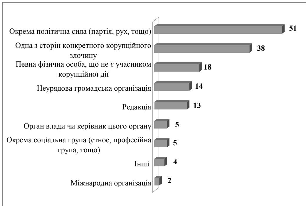
Рисунок 3. Найбільш імовірні замовники публікацій про викривання фактів корупції за оцінками журналістів (у % до тих, хто відповів (N=300))

Про низький потенціал ЗМІ свідчить і той факт, що правоохоронні органи не реагують на повідомлення у ЗМІ про корупцію. Аналіз журналістами прожективних ситуацій показує, що оприлюднення факту корупційного злочину діючого міністра, на думку половини опитаних журналістів (55%) не буде мати для винуватця ніяких наслідків або обмежиться обговоренням у ЗМІ (52%). Третина (29%) опитаних вважають, що подібне інформаційне повідомлення може стати приводом для перевірок з боку правоохоронних органів. Показово, що лише 17% опитаних вважають, що оприлюднення корупційного скандалу може вплинути на рейтинг політичної сили, яку представляє діючий міністр.