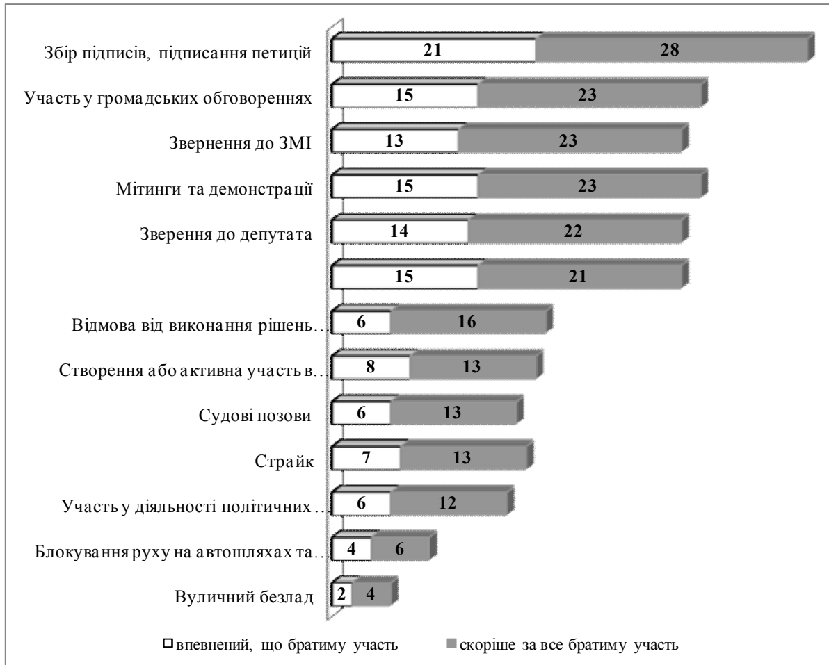
Рисунок 2. Розподіл відповідей респондентів на питання «В яких акціях протесту проти дій корумпованого чиновника Ви скоріше за все візьмете участь? (у % до загальної кількості тих, хто відповів (N=2027))

взяти участь до 50% респондентів. Ці дані вступають в дисонанс з оцінками досвіду, які свідчать, що за останній рік в подібних заходах приймали участь не більше 6% респондентів. Важливо, що респонденти обрали захід, який не передбачає анонімності (підпис завжди ставиться особисто з фіксацією паспортних даних). Готовність прийняти участь в подібному заході свідчить про те, що антикорупційно спрямована протестна активність вважається безпечною і поважною громадською позицією. Ранжування підтримки інших видів активної протидії корупційним діям чиновників представлено рисунком 2.