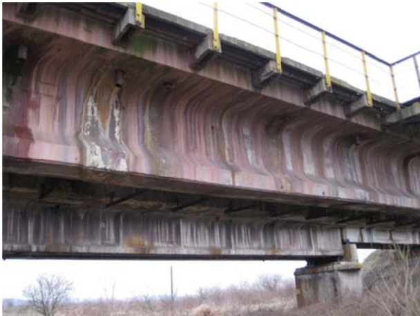
Рис. 4. Зміна забарвлення бетоном по усій поверхні залізобетонної прогонової будови

На усіх мостах виявлено ознаки біологічної корозії бетону. Це такі як зміна забарвлення бетоном по усій поверхні залізобетонної прогонової будови (рис. 4), патьоки зеленкуватого, чорного і інших кольорів у місцях підвищеної вологості (рис. 5), нарости моху та кристалізація продуктів життєдіяльності бактерій на поверхні бетону (рис. 6) і ін.