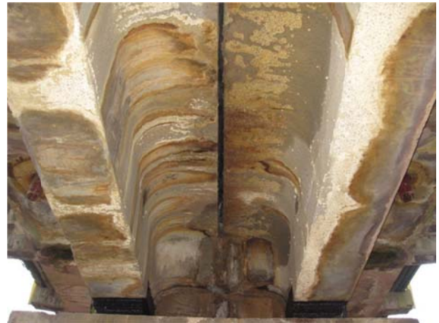
Рис. 2. Іржаві патьоки на внутрішній поверхні плити баластового корита та ребер залізобетонних прогонових будов

Характер патьоків на внутрішній поверхні плити баластового корита та ребер залізобетонних прогонових будов дозволяє зробити висновок, що відбувається просочування води не тільки скрізь розладнання у зазорі а і скрізь бетон плити баластового корита.