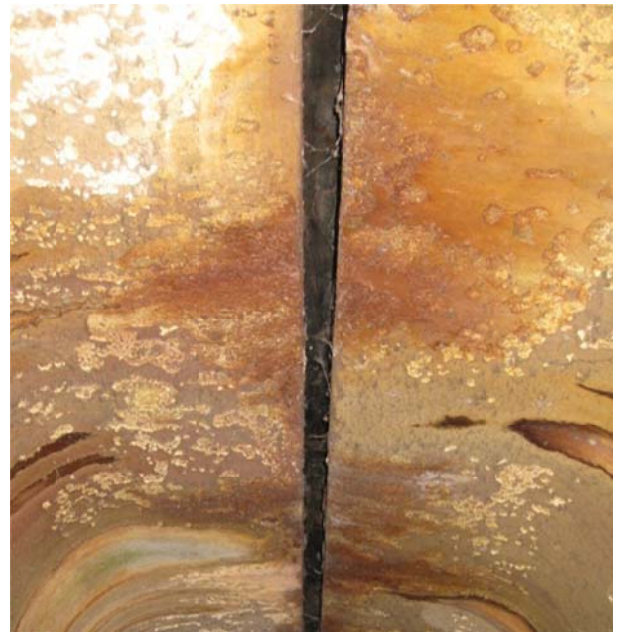
Рис. 3. Нашарування кристалізації хімічних речовин на внутрішній поверхні плити баластового корита

Ще одним наслідком просочування брудної води крізь бетон плити баластового корита є утворення на внутрішній поверхні плити нашарувань кристалізації хімічних речовин внаслідок хімічної корозії бетону (рис. 3).