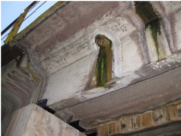
Рис. 1. Патьоки вилуговування на поверхні залізобетонних прогонових будов

Усі прогонові будови мають зруйновані іржею водовідвідні трубки. Внаслідок чого вода із плити баластового корита просочується навколо зруйнованих трубок попадає на бокову поверхню ребра прогонової будови і суцільною смугою стікає по поверхні (див. рис. 1). Враховуючи той факт, що дані мости експлуатуються на під'їзних колях підприємства хімічної промисловості, зрозуміло, що на поверхню баласту попадають речовини, пов'язані із виробничим процесом підприємства, а потім ці речовини розчиняються у воді під час дощів та просочуються через баласт і зруйновані водовідвідні трубки на конструкції прогонової будови. В результаті дії забрудненої води у бетоні відбувається процес хімічної та біологічної корозії. Про що свідчать різні кольори забарвлення цих патьоків: чорний та зелений, відтінки коричневого і ін.