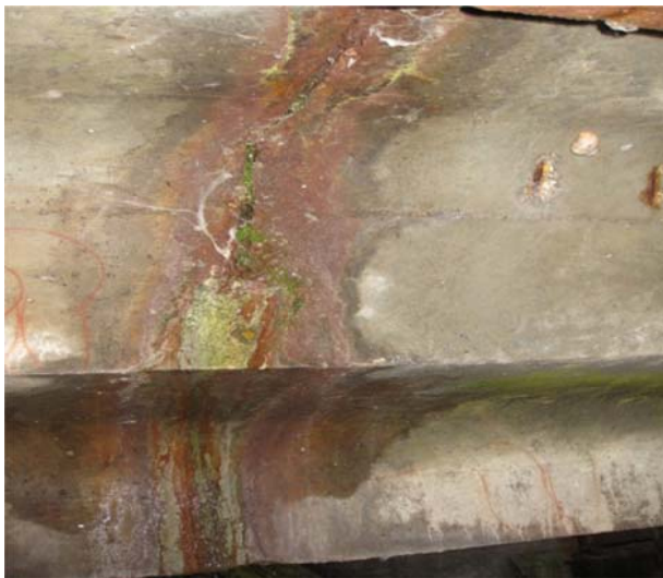
Рис. 5. Ознаки біологічної корозії бетону у місцях підвищеної вологості

Аналізуючи дефекти наведені на рис. 4, 5 і 6 можна зробити висновок, що на поверхні і у середині бетону залізобетонних прогонових будов відбувається активний процес біологічної корозії, який супроводжується кристалізацією на поверхні бетону продуктів життєдіяльності мікроорганізмів. Такий процес є небезпечним, тому що може привести до порушення