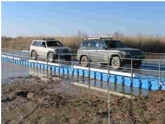
Рис. 7. Понтонний міст під рух автотранспорту та пішоходів