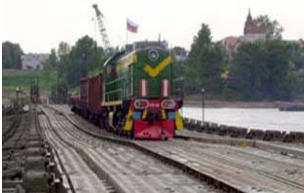
Рис. 1. Загальний вигляд залізничного моста-стрічки МЛЖ-ВФ-ВТМета

Таким чином якщо поєднати потреби Міністерства оборони та Міністерства з надзвичайних ситуацій, то повинні бути розроблені прості конструкції які призначені окремо для руху залізничного транспорту, автомобільного та пішоходів. При обґрунтуванні доцільності можна проектувати такі наплавні мости в наступних комбінаціях: