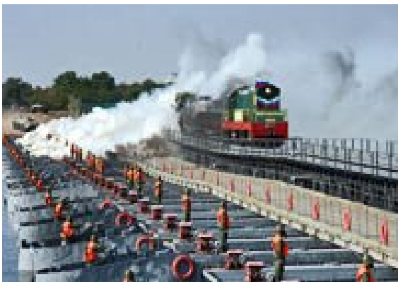
Рис. 8. Наплавний залізничний міст (НЖМ-56), дослідження

Що стосується баштових конструкцій ІМІ-60, які призначені для влаштування тимчасових опор, то вони можуть бути замінені більш ефективними інвентарними конструкціями МІК-С та МІК-П (які вже витіснили менш ефективні інвентарні конструкції з кутиків – УІКМ), оскільки вони також мають меншу вагу (наприклад стійка ІМІ-60 має вагу 1 п.м. – 68,7...82,0 кг і має несучу здатність на стиск – 121,8 тс, в той час як 1 п.м. МІК-С важить