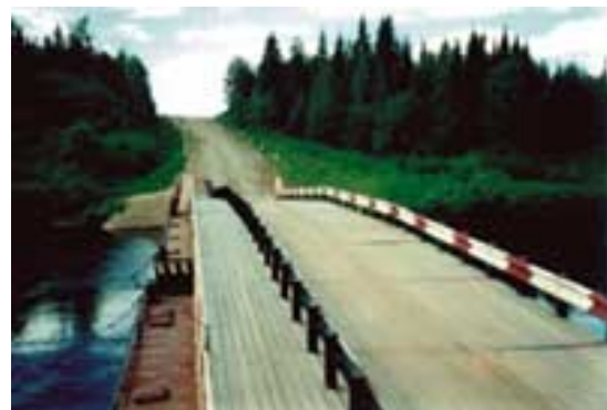
Рис. 5. Понтонний міст під рух автотранспорту та пішоходів