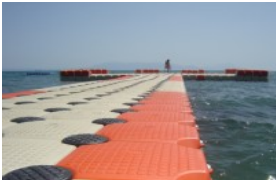
Рис. 6. Варіант з'єднання понтонів