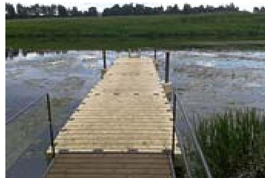
Рис. 4. Понтон Компанії «RUSPONTON»