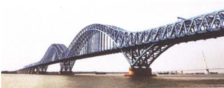
(b) Dashengguan Bridge