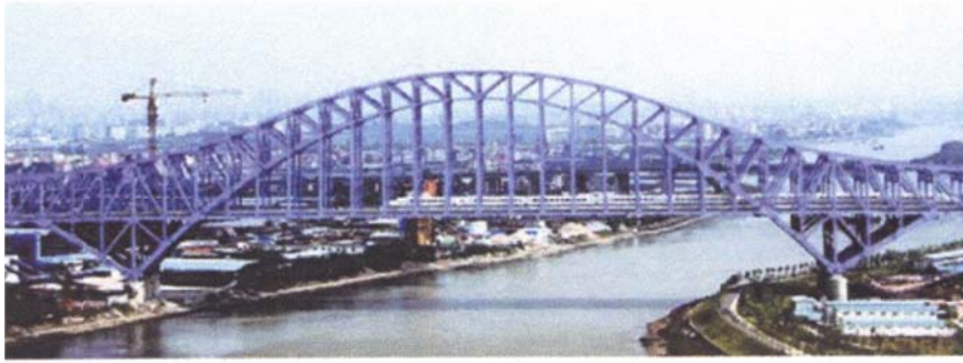
(a) Dongping Bridge