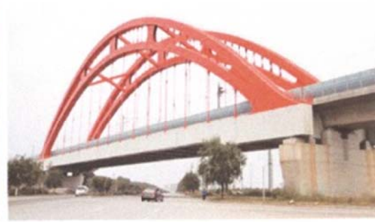
(d) Xinkaihe Bridge