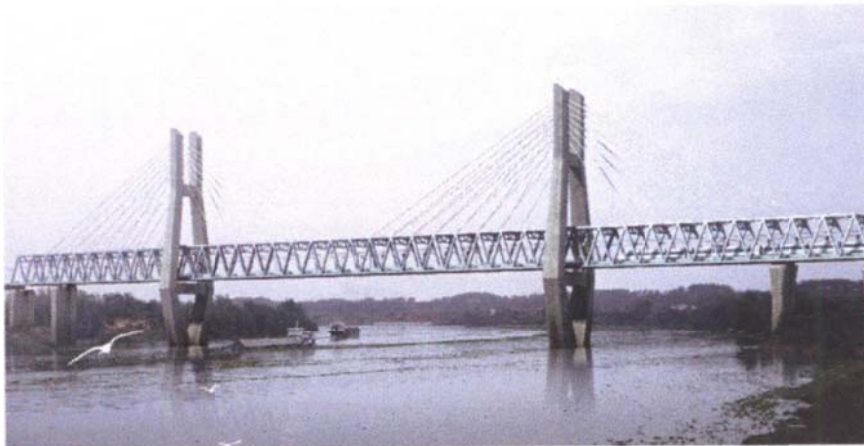
(b) Yujiang Bridge