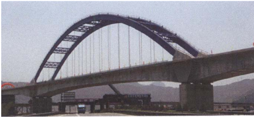
(a) Kuyang Bridge