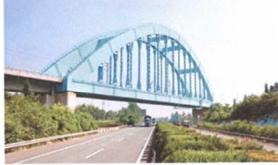
(b) Tingsihe Bridge