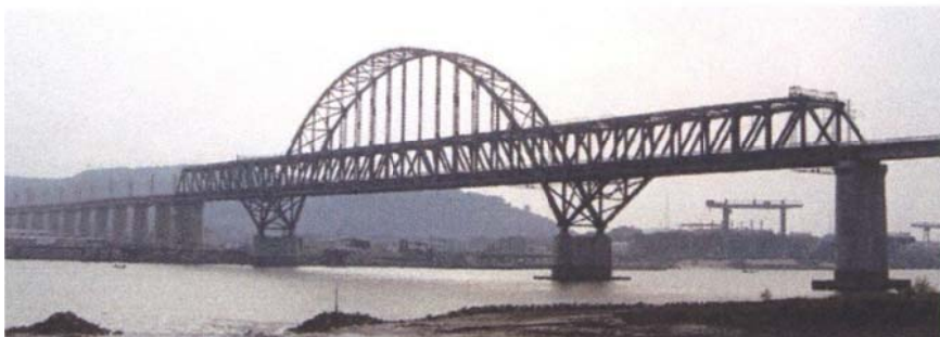
Рис. 4. Мости типа «Ферменная арка»

Один из краеугольных вопросов для мостов на линиях HSR – контроль деформаций (перемещений).