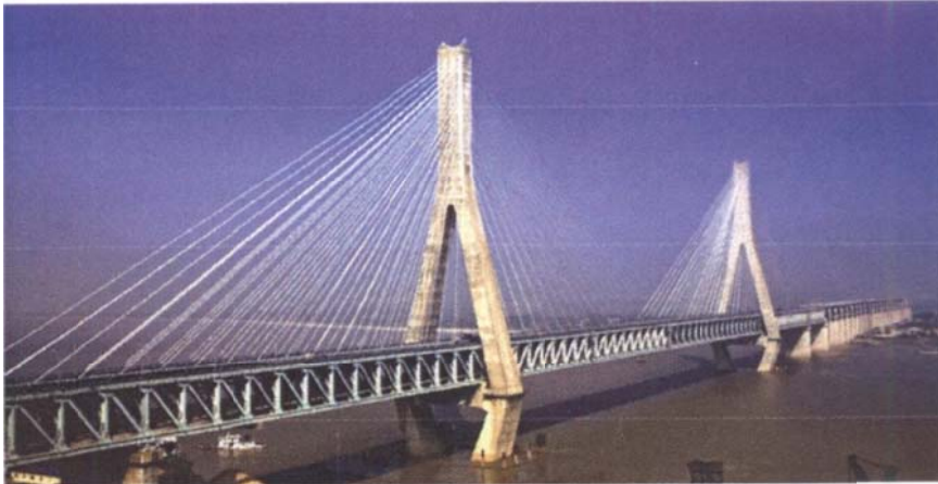
(a) Tianxingzhou Bridge