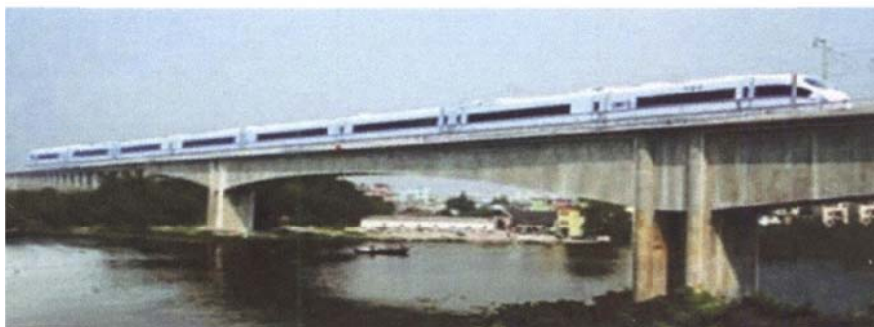
(b) Liuxihe Bridge