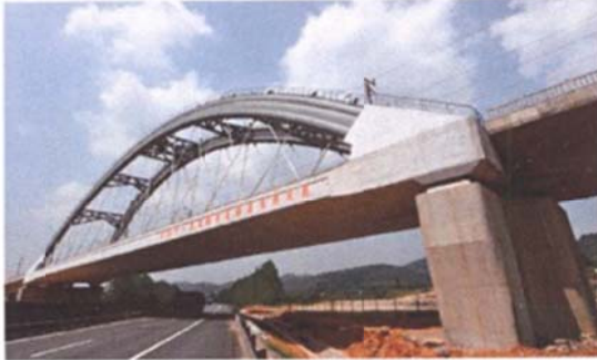
(a) Hujawan Bridge