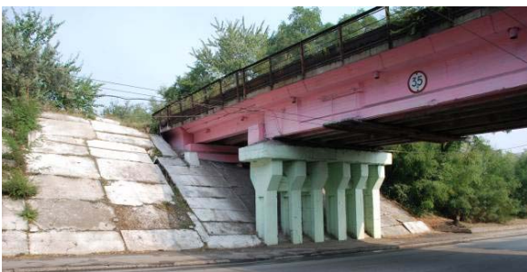
Рис. 2. Загальний вид укріплення конусів насипу