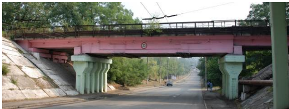
Рис. 1. Загальний вид шляхопроводу

На замовлення промислового підприємства Дніпропетровської області був виконаний робочий проект на капітальний ремонт одноколієного залізничного шляхопроводу (рис. 1, 2 і 3).