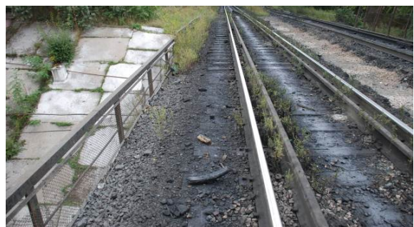
Рис. 3. Загальний вид мостового полотна

Проект виконувався за договором від 17 жовтня 2013 року, на основі завдання на проектування, матеріалів інженерно-геодезичних, інженерно-геологічних вишукувань і натурних обстежень, які були виконані спеціалістами Дніпропетровського національного університету залізничного транспорту імені академіка В. Лазаряна у жовтні 2013 р.