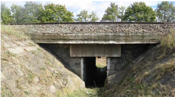
Рис. 4. Малий залізничний міст, з розрахунковим прогоном до 1,5 м

довідкового Додатку Г [3]. Нормативною документацією зовсім не враховані особливості визначення категорії складності лінійних об'єктів інженерно-транспортної інфраструктури залізничного транспорту, в залежності від їх техніко-економічних показників та великою різницею у складності проектних рішень. Наприклад, стосовно мостів, чи можливо за складністю проектних рішень прирівнювати проектні роботи на капітальний ремонт «малого» залізничного мосту з розрахунковим прогоном < 1,5 м (рис. 4) та позакласний міст, довжиною понад 1,5 км (рис. 5)?