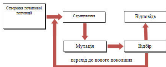
Рис. 1. Принципова схема генетичного алгоритму

Принципова схема генетичного алгоритму наведена на рис. 1.