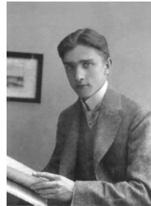
Стефан Банах, 1919 р., фото з книги [1]

У 1917 р. Банах приїжджав до Львова на габілітаційну лекцію Штайнгауза. У 1918–20 рр. учбові заклади Львова працювали нерегулярно. Штайнгауз виїхав зі Львова. Банах у 1919 р. зробив дві доповіді на засіданнях Математичного товариства у Кракові.