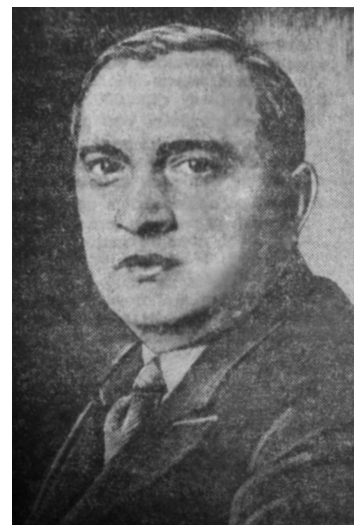
Фото з газети “Вільна Україна” за 13 червня 1941 р.