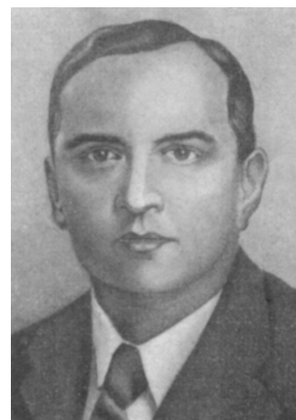
Фото з книги “Курс функціонального аналізу”

Великий вплив на розвиток досліджень з функціонального аналізу у світі мала монографія Банаха “Théorie des opérations linéaires”, яка була опублікована у 1932 р. Польською мовою вона вийшла у 1931 р., а український переклад, який зробив Мирон Зарицький, побачив світ у 1948 р. під назвою “Курс функціонального аналізу”. Монографія швидко дістала широке визнання, з того часу підходи і термінологія Банаха були прийняті всюди. Важливою частиною монографії були “Зауваження”, які містили історичні коментарі, зауваження про зв’язок понять і тверджень, відкриті проблеми та шляхи їх розв’язку. В українському перекладі ці “Зауваження” значно змінені і розширено з врахуванням досліджень в математиці до 1940 р.