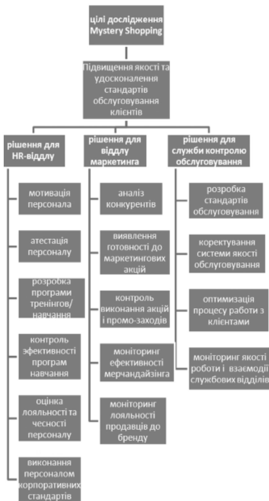
Рис. 1. Цілі дослідження за методикою Mystery Shopping

основі узгодженої з замовником анкети. Використовується в основному для оцінки якості обслуговування співробітниками компанії клієнтів. Відстежується рівень професіоналізму співробітників компанії, техніка продажу і чіткість дотримання персоналом стандартів поведінки.