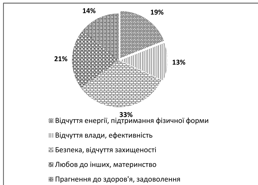
Рис.2. Сегменти ринку води на основі психографічних характеристик

Окремо було досліджено моделі поведінки при купівлі бутильованої води. Найчастіше серед місць покупки води згадуються такі торговельні точки, як невеликі продуктові магазини та супермаркети, менш часто – кіоски, павільйони та універсами. Для газованої, сильногазованої, низькогазованої та ароматизованої типів води, купівельна поведінка