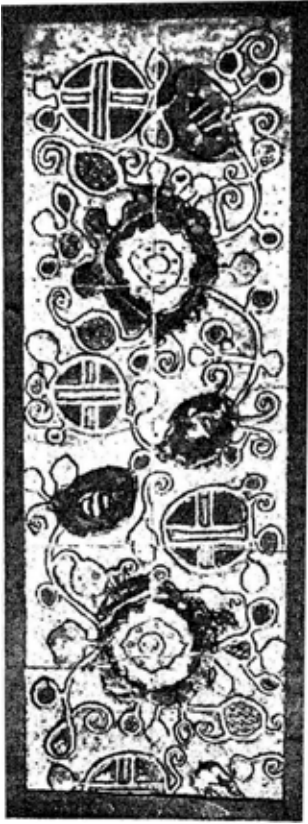
Заставка з каталогу «Художественно-керамическое производство «Гольдвейн-Ваулин». 1910. Автор, ймовірно, П. Ваулін. Поч. XX ст.

була шестикутна форма дверей, про що знаходимо свідчення в роботі В. Самойловича «Украинское архитектурное творчество» [6]. Автор зазначає, що «...главным образом в Полтавской области, где применялись проемы шестиугольной формы, при устройстве дверей со скошенными верхними углами для обвязки использовалось дерево, имеющее естественный изгиб. Такое бревно распиливалось или раскалывалось вдоль на две части и устанавливалось как обвязка проема, причем изогнутые части обращались внутрь проема. Таким образом, форма дверного проема со скошенными углами имела определенный конструктивный смысл» [6, с. 40, 41]. Така форма дверей та вікон стала, зрештою, важливою рисою українського архітектурного стилю початку XX ст. Усе вищезгадане набуває сенсу при розгляді каміна роботи Петра Вауліна, що зображений на сторінці XXIX рекламного проспекту його керамічної майстерні в с. Кікеріно.