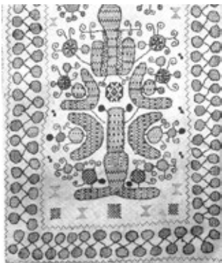
Фрагмент полтавського рушника. XIX ст.

Широке використання досягнень світової цивілізації, звернення до народних традицій сприяло успішній продукції підприємства «Гельдвейн — Ваулін». Тісний взаємозв'язок російської та української культури в означеній царині сприяв їх взаємозбагаченню, створенню нового, неповторного стилю окремих виробів майстерні. Оновлення і нове прочитання спільного культурного спадку слов'янських етносів у майбутньому може стати запорукою збереження їх самостійної національної складової в колі європейських народів, джерелом нових неповторних знахідок у царині народного та професійного мистецтва.