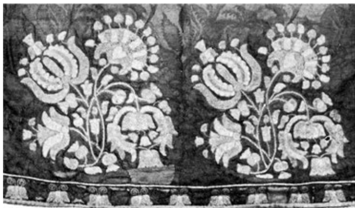
Фрагмент підризника. XVII ст.