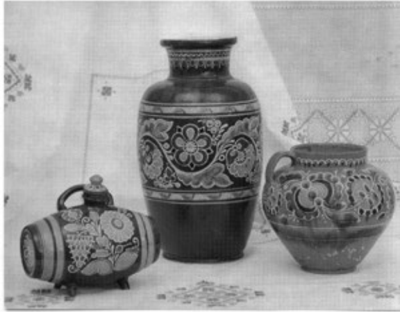
Традиційна Опішнянська кераміка. Середина XX ст.

Насамкінець хочеться згадати про такий важливий елемент українського народного житла, як піч. Можна сказати, що довкола неї зосереджувалося домашнє життя родини. Вона, як центр хати, завжди була чисто вибілена та прикрашена рослинним візерунком [6, с. 143]. Характерною особливістю українського житла