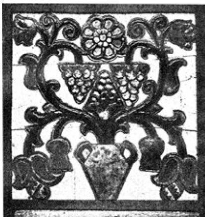
Заставка з каталогу «Художественно-керамическое производство «Гольдвейн-Ваулин». 1910. Автор, ймовірно, П. Ваулін. Поч. XX ст.