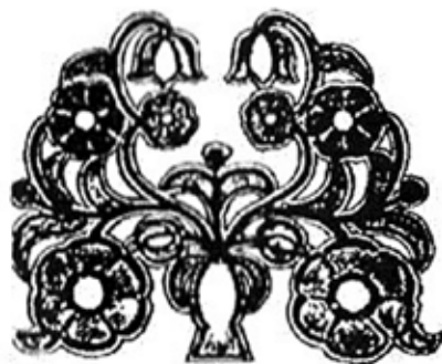
Елемент фасадного декору будівлі Полтавського краєзнавчого музею. Початок XX ст.