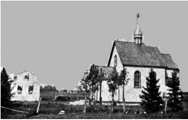
Церква і дзвіниця в Тиндал, Манітоба (1916–1917 рр.)

Релігійне середовище, в яке потрапили українці, що дотримувались здебільшого східного обряду (православні та греко-католики), було чужим для них, та й навіть, з точки зору історичної пам'яті, — ворожим (римо-католицьким і протестантським).