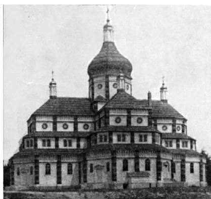
Церква Покрови пр. Богородиці в Мавтен Ровд, Ман (1923–1925)

Навіть короткий огляд прикладів сакральної архітектури першої української еміграції вказує, що найчастіше застосовувалось спрощене рішення архітектурно-мистецького образу українського храму. Більшість храмів цього періоду «дерев'яні й збудовані переважно методом зрубу. Також церкви «хатнього» типу були однефні, завершені просто церковним хрестом або однією банею, чи ліхтарем з хрестом споруди. [...] В архітектурі церков хатнього типу домінує стриманість та примітивізм форм» [3, с. 62].