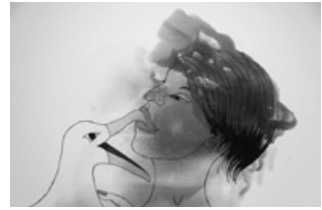
Кіндер Альбум. «Lalbatros ton atouir» / «Альбатрос моє кохання», Будинок художника: Котор, 2016

битого скла окремих видів вогнепальної зброї. «Стега» носила антивоєнний посыл та мала ще концептуально конституційні засади. Стега (присяга) — перший письмовий закон Чорногорії, ухвалений Петром I Петровичем Негошем (1748–1830; митрополит і правитель Чорногорії, канонізований як Петро Цетінський), де, зокрема визначалося, що жителі Чорногорії усі політичні і військові дії вестимуть тільки спільно [7]. Кажучи коротко, Стега для Чорногорії — на кшталт Руської правди XI–XII ст. і Конституції Пилипа Орлика 1710 року для нас. Проект з ідеєю спільності, звичайно, апелював до подій в Україні.