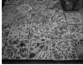
Ірина Ластовкіна. «Чорногорія 2», галерея Dukley Gardens, Будава, 2015