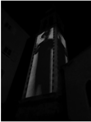
Андрій Базюта. Проект «Живе місто» / «Living Town» інсталяція «Жива вежа» / «Living Tower», Старе місто, Будава, 2015