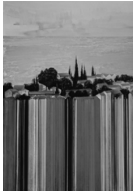
Георг Гусєв. «Сповідь резидента», Дюклей Арт Центр, Котор, 2015