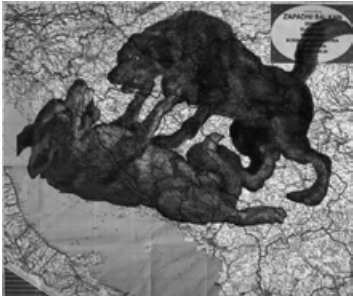
Юрій Соломко. «Чорногорія 2», галерея Dukley Gardens, Будава, 2015