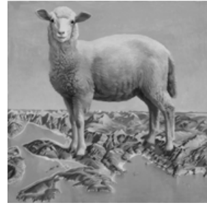
Юрій Соломко. «Чорногорія “Земля”», полотно, олія 138x135 см, Цетине, 2015

твори, де автор працює з процесами творення нового міфу і героїнею якого є Марина Абрамович, та два об'єкти, де автор знову звертається до картографії (камінь, вкритий назвами поселень, буквально апелюючи до поняття чорна гора, перетворюється на карту країни і захисний шолом, вкритий картою Чорногорії, з якого проросла рука з жестом благословення). У двох графічних роботах митець поєднує мапи країни із зображенням ікони сучасного мистецтва Марини Абрамович, енічної чорногорки, вписуючи в картографічну легенду свої текстові вставки-референції до її робіт «Балаканский еротичний епос», «Мистецтво має бути красивим, художник має бути красивим, країна має бути красивою».